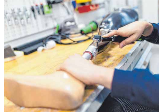
Fachmännische Maßanfertigung einer Unterschenkelprothese in der Orthopädietechnik-Werkstatt.

Kooperation mit Scheidegg In Kooperation und Zusammenarbeit mit dem Diagnostikzentrum Scheidegg können seitdem eine umfangreiche